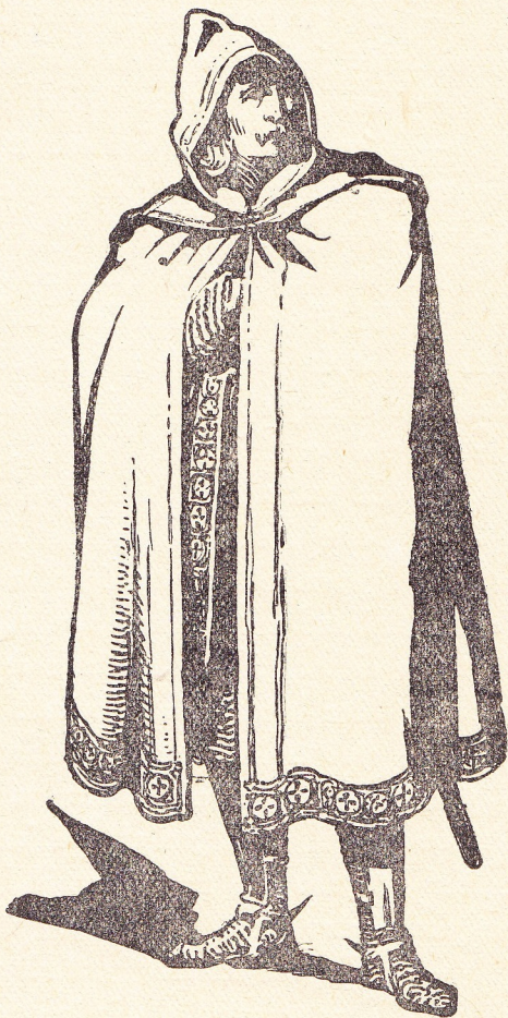
De zwarte Jager.

Bij die tafel zaten drie mannen, elk eene kroes bier voor zich. De voornaamste dier personen, met dewelke wij thans onze lezers laten kennis maken, was voorzeker degene, die, tusschen de beide anderen gezeten, met veel aandacht naar hunne woorden scheen te luisteren. 't Was een man van ongeveer dertig jaar, slank en welgebouwd. Al zijn bewegingen verrieden vlugheid en kracht. Zijn door de zon gebruint gelaat was regelmatig en fijn van lijnen; zijn oogopslag was doordringend en gebiedend; om zijn mond, overschaduwde door een langen, afhangenden knevel, speelde bijwijlen een spotachtig lachje. Wat zijne kleedij betreft, deze hield het midden tusschen die van een edelman en van een poorter. Zijn blauw en groen gestreepte lijfrok, alhoewel van fijne stof, was niet met goud geborduurd, zooals bij de meeste edelen; op sommige plaatsen vertoonde hij zelfs de sporen van herstellingen: een mantel van effen bruin laken was hem over de schouders bevestigd bij middel van eene zilveren gesp. Nauwsluitende bruine hosen deden zijne gespierde beenen voordeelich uitkomen; zijne voeten, eerder klein dan groot, staken in hooge, eenigszins puntige schoenen van rood leder, dat,